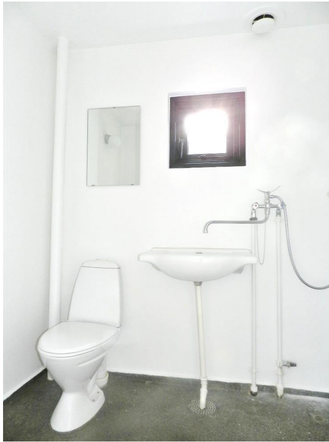
Badeværelse i boligtype A (Rækkehus i én etage) som det ser ud i dag i en bolig, der er klar til indflytning.