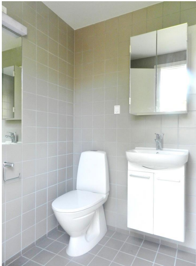
Badeværelse i boligtype A (Rækkehus i én etage) som det kan komme til at se ud efter renovering.