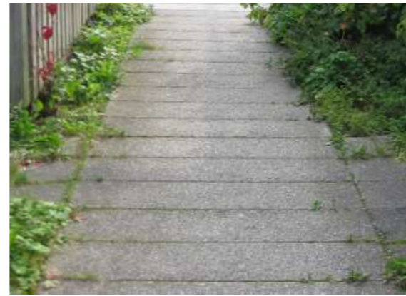
STRÆDEFLISER (30X120 CM)

Begge udgaver af trappetrin er som ønsket efter udførelse af prøvehusene, special elementer som de oprindelige.