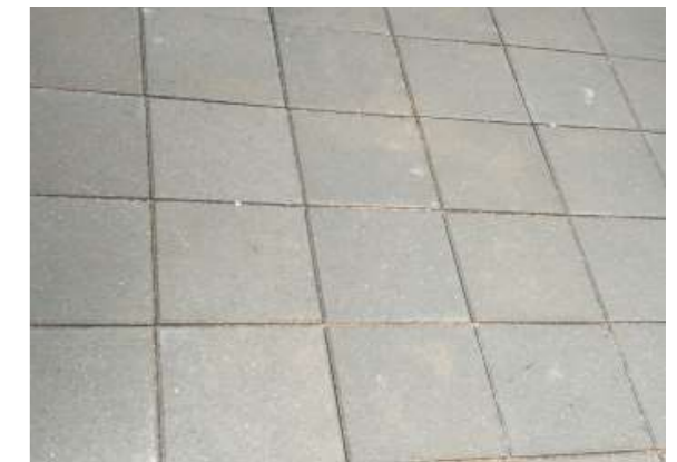
MODUL 30 FLISER (30X30 CM)