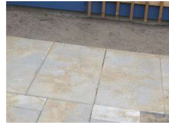
SOLDATERFLISER (45X90 CM)